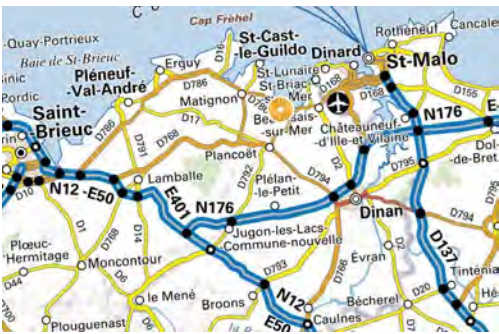
Carte IGN Geoportail