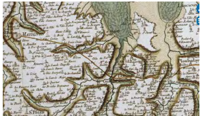
Carte Cassini, Geoportail, 1740