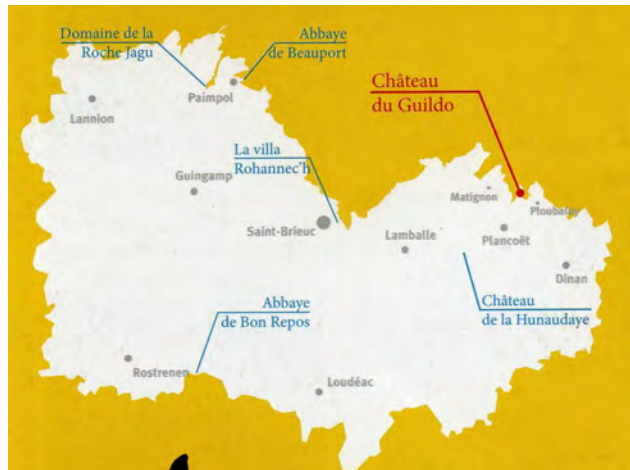
Plan Conseil départemental 22, dépliant le Guildo