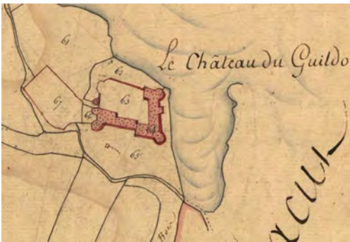
Extrait du cadastre de 1827, section A première feuille (AD 22, 3 P 54/1)

Numérote de 1 à 5 les cartes et plans suivants de la plus grande à la plus petite échelle.